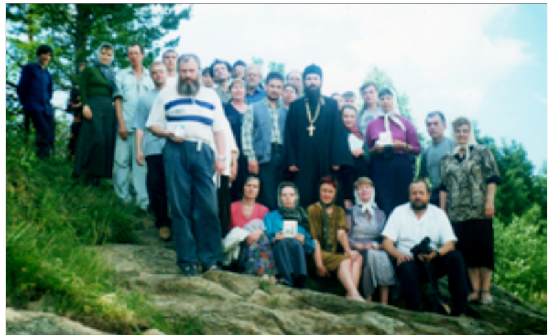
Участники встречи на берегу реки Туры, на камне, где удил рыбу праведный Симеон Верхотурский.

Ободрённые поддержкой, мы отправились из Екатеринбург в г. Верхотурье. В духовной сто- лице Урала благоговейно при- ложились к святыням Свято-По- кровского женского монастыря, поклонилась мощам праведного Симеона, что почивают в Свято- Никольском мужском монастыре.