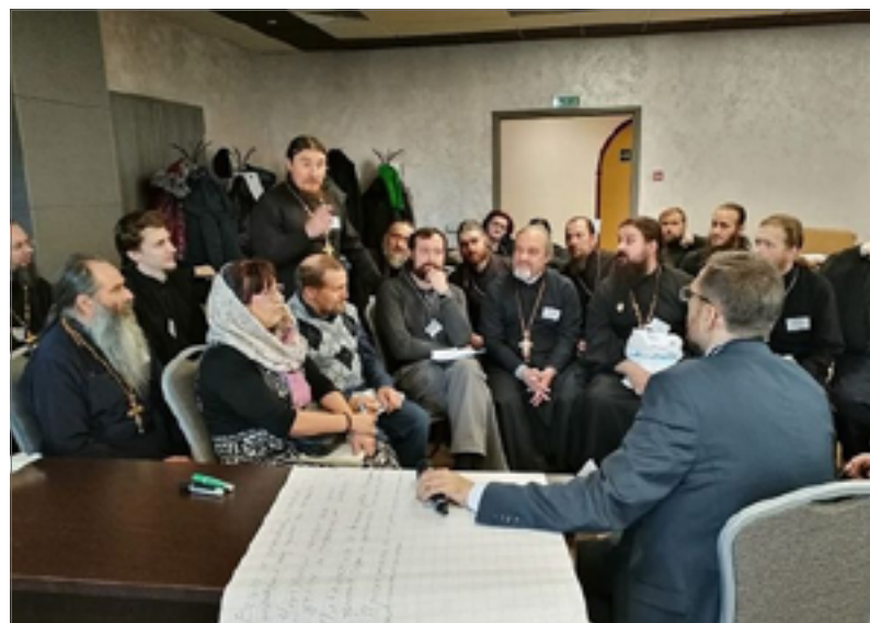
Основные темы слета православных трезвенников – развитие общины трезвости на приходе, а также популяризация идей трезвости и здорового образа жизни. Рабочий момент слета православных трезвенников.

В 2010 г. в Синодальном Отделе по благотворительности и социальному служению Русской Православной Церкви были соз-