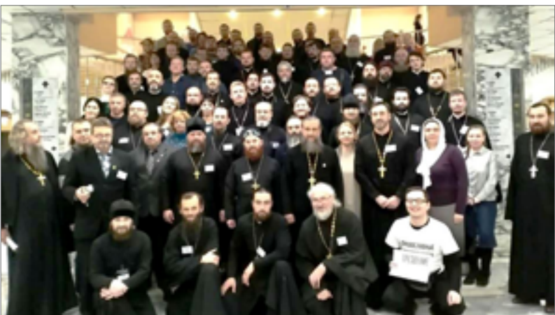
IX Общецерковный съезд по социальному служению

Из Казанской епархии в трезвенных мероприятиях приняли